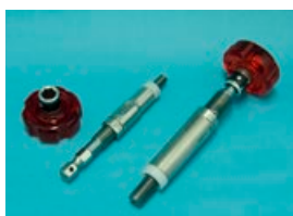
マンドルタイプ(電動対応)

※プリワインダー式は、手動専用となります。 ※ For pre-winder tools, only hand-operated types are available. ※電動非対応となります。(手動専用) ※ Power tools are not available. (hand-operated types only)