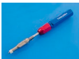
ユニファイ抜取(電動非対応)