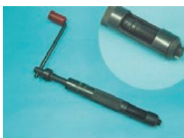
プリワインダー式