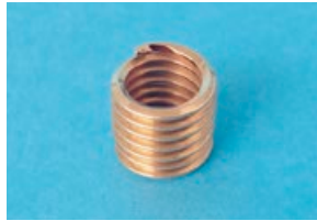
リン青銅 Phosphor Bronze